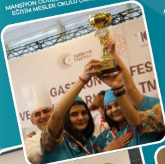
MEB GASTRONOMİ FESTİVALİ VE YEMEK YARIŞMASI MANSİYON ÖDÜLÜ KONYA KARATAY ÖZEL EĞİTİM MESLEK OKULU ÖĞRENCİLERİ